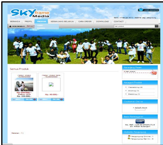
Gambar 3 : Tampilan Halaman Produk