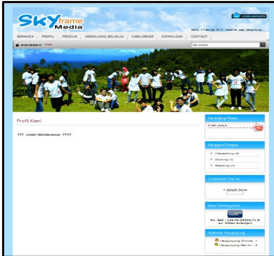
Gambar 2 : Tampilan Halaman Profile