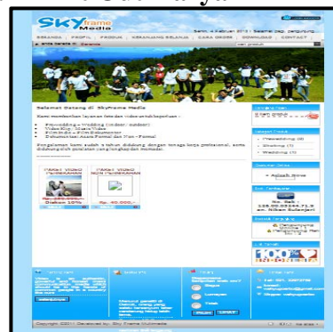
Gambar 1 : Tampilan Beranda