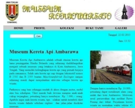
Gambar 10. Tampilan Link (Kereta Api Ambarawa)