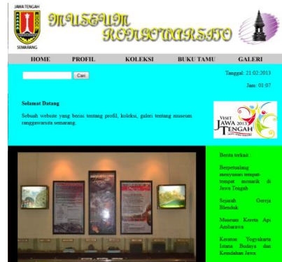
Gambar 1 : Tampilan Menu Home