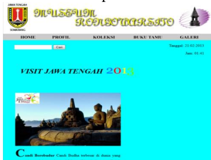
Gambar 7 : Tampilan Menu Visit Jawa Tengah 2013