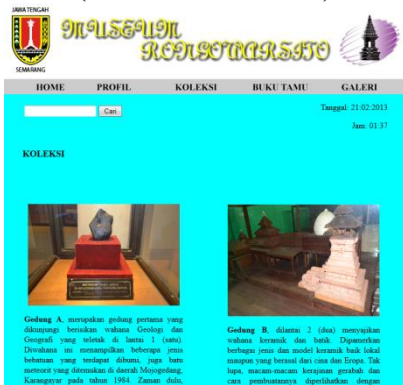
Gambar 5 : Tampilan Menu Koleksi