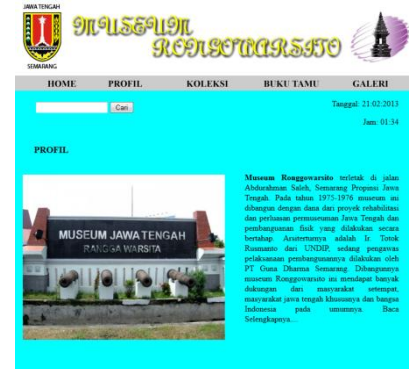
Gambar 2 : Tampilan Menu Profil