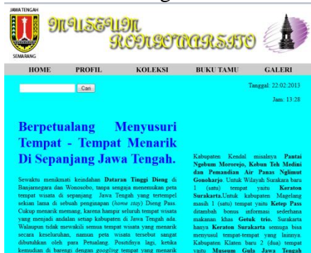
Gambar 8 : Tampilan Link (Berpetualang)