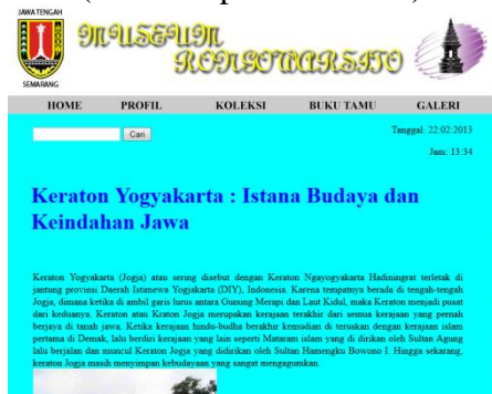
Gambar 11 : Tampilan Link (Keraton Yogyakarta)