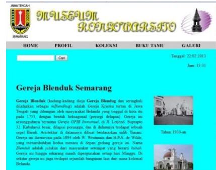
Gambar 9 : Tampilan Link (Gereja Blenduk)