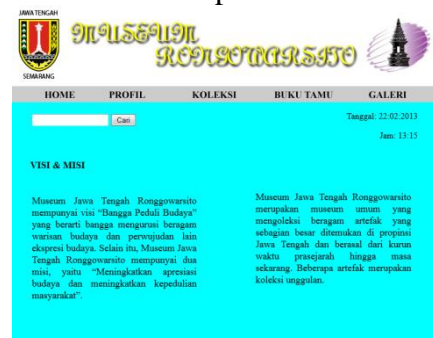
Gambar 3 : Tampilan Menu Profil (Visi & Misi)