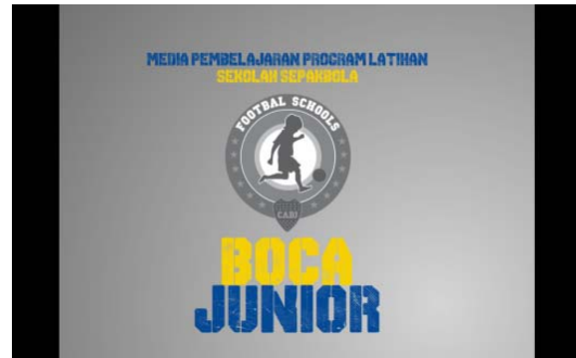
Gambar 2. Loading

Bila aplikasi media pembelajaran dijalankan, maka pertama akan muncul tampilan loading sebelum ke menu utama.