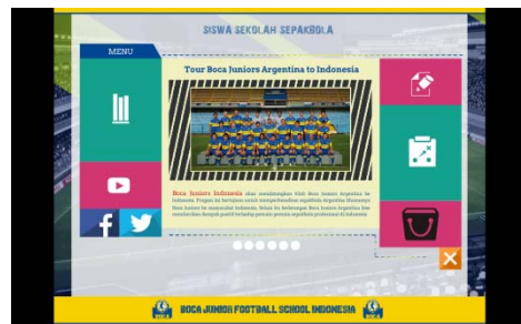
Gambar 3. Tampilan Menu Utama

Menu utama berisi beberapa tombol navigasi untuk menuju ke sub menu yang ada.