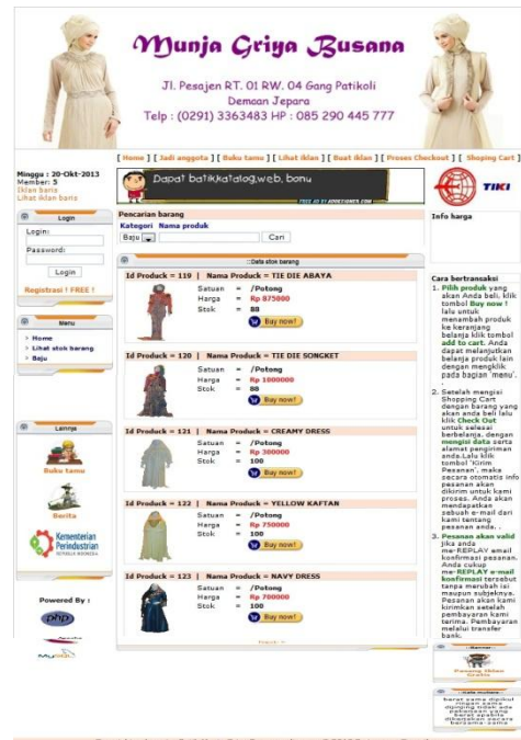
Gambar. Layout Halaman Utama Pada Butik Munja Griya Busana Jepara