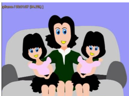
Gambar 4.11 Scene 11