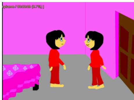
Gambar 2.3 Scene 3