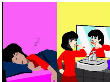
Gambar 2.4 Scene 4