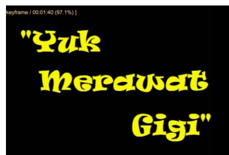
Gambar 4.12 Scene 1