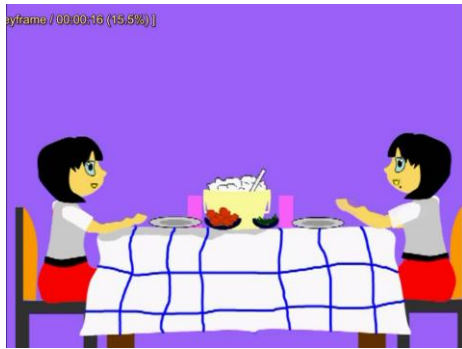
Gambar 2.5 Scene 5