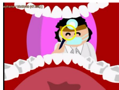
Gambar 4.8 Scene 8