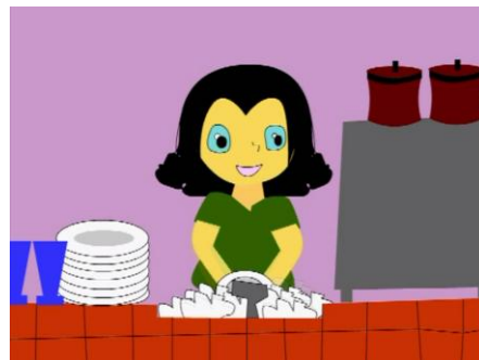
Gambar 2.2 Scene 2