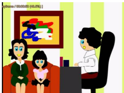
Gambar 4.9 Scene 9