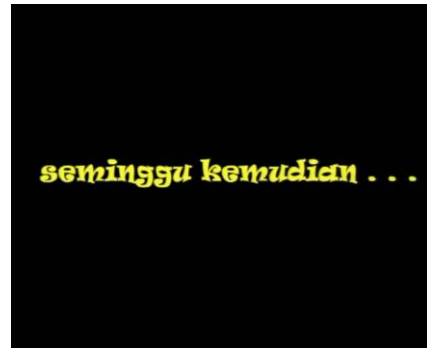
Gambar 2.6 Scene 6