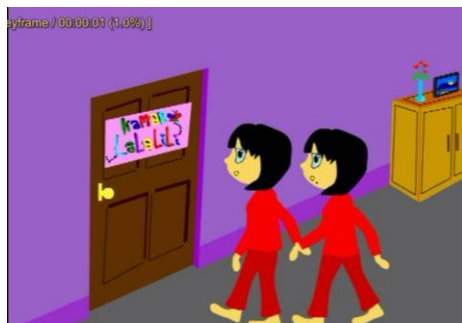
Gambar 2.1 Scene 1