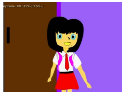
Gambar 4.10 Scene 10