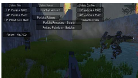
Gambar 4 Tampilan Awal Game First Person Shutter

Berikut adalah tampilan awal Game First Person Shutter ini terdapat Menu Start terdapat Level 1 dan 2. Untuk memulai klik Start di klik sekali kemudian silahkan memulai game anda dan dibawahnya ada tombol quit game untuk tombol keluar dari permainan ini.