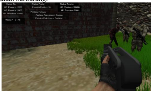
Gambar 5 Tampilan Game ketika bertemu Zombie

Kemudian selanjutnya adalah terlihat pada gambar zombie yang akan ditembak oleh player maka ketika menembak zombie maka health point dan attack point pada zombie akan berkurang.