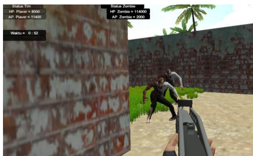
Gambar 6 Tampilan Game Ketika Zombie Menghampiri Setelah Memburu Zombie