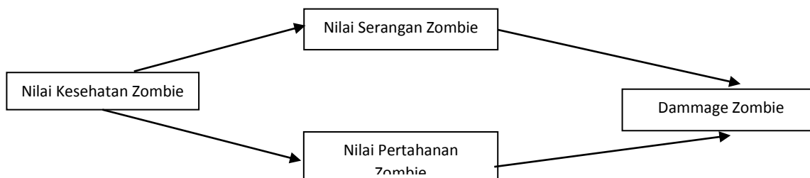
Gambar2 Alur Umum Scoring Non Player Character

Tentang produk, sistem,model, formula, rumus teori. Nama sub judul disampaikan dalam penelitian.