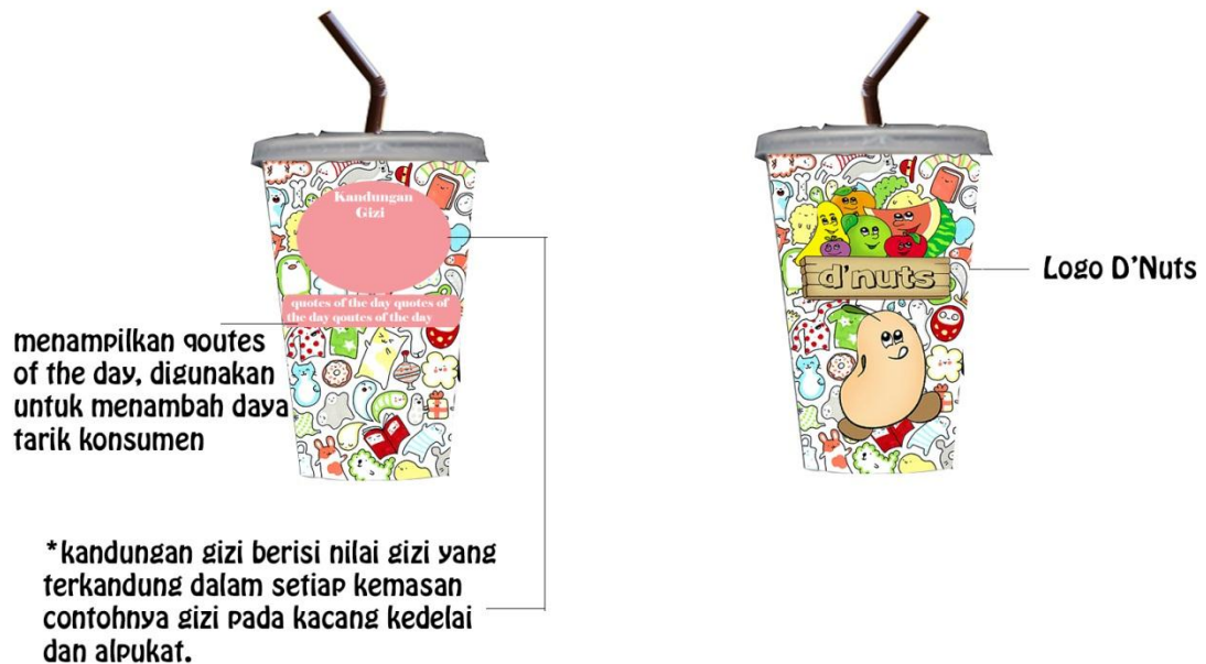
Gambar 2. Kemasan D’Nuts