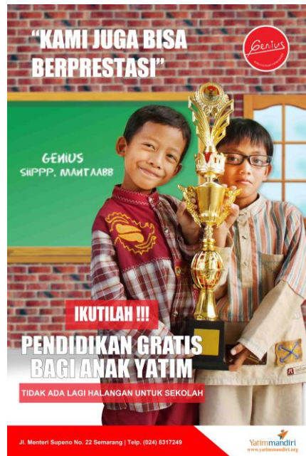
Gambar 8 : poster 2