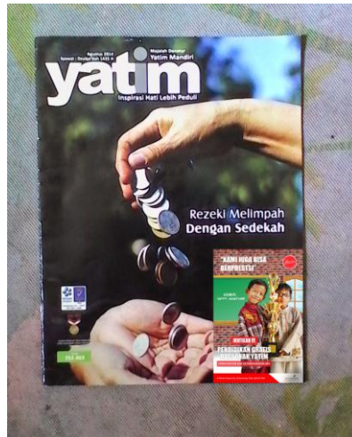
Gambar 9: Majalah