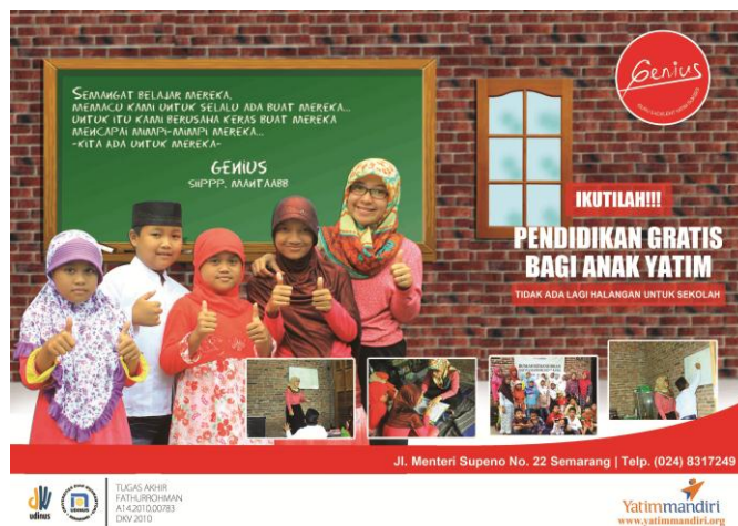
Gambar 7 : poster 1