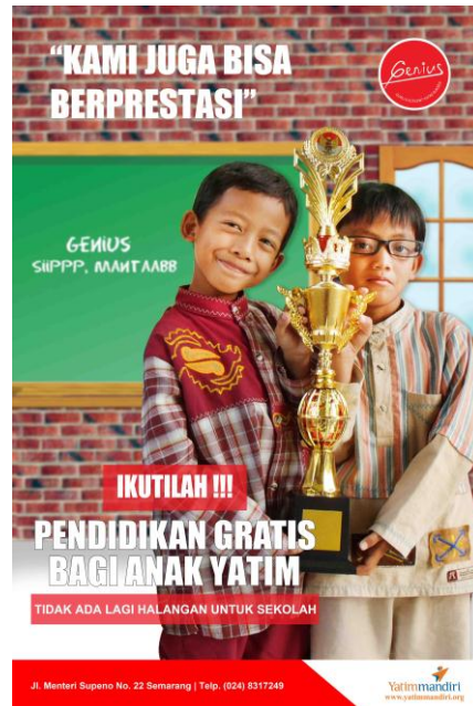
Gambar 6 : Comprehensive Poster 2