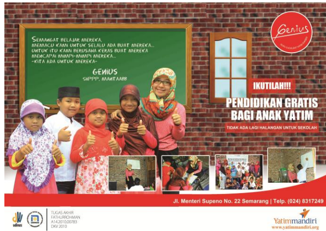
Gambar 4 : Comprehensive poster 1