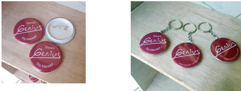
Gambar 11 : Pin & Ganci