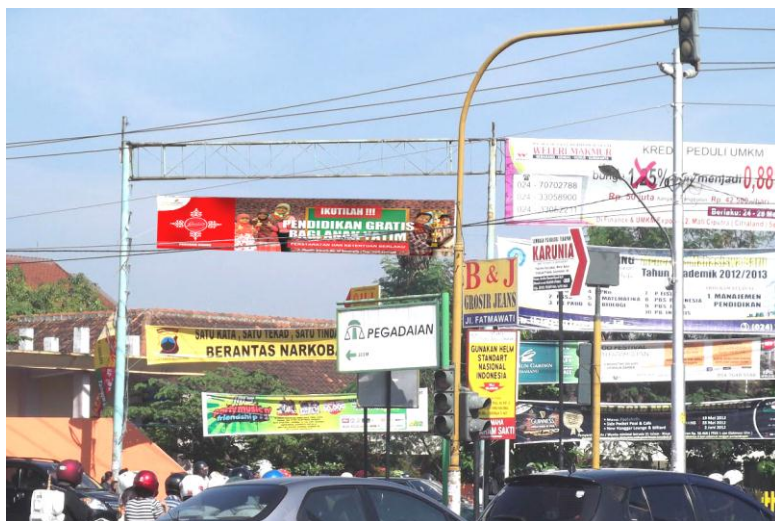
Gambar 12: Spanduk