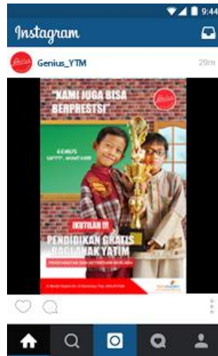
Gambar 13: Instagram