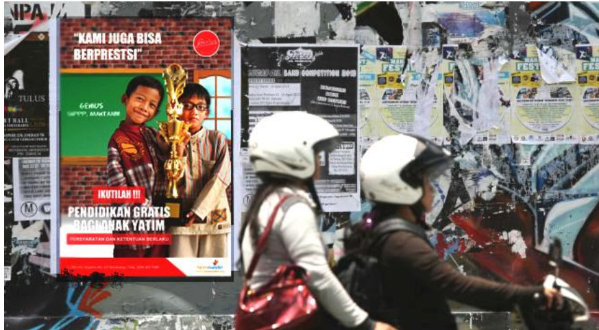
Gambar 10 : Poster public