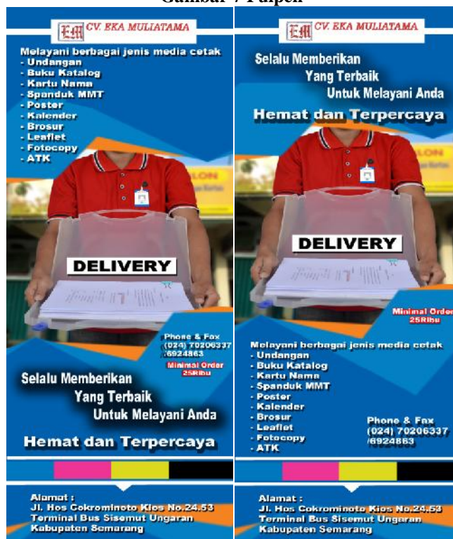
Gambar 8 Stiker