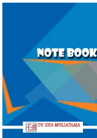
Gambar 6 Note Book