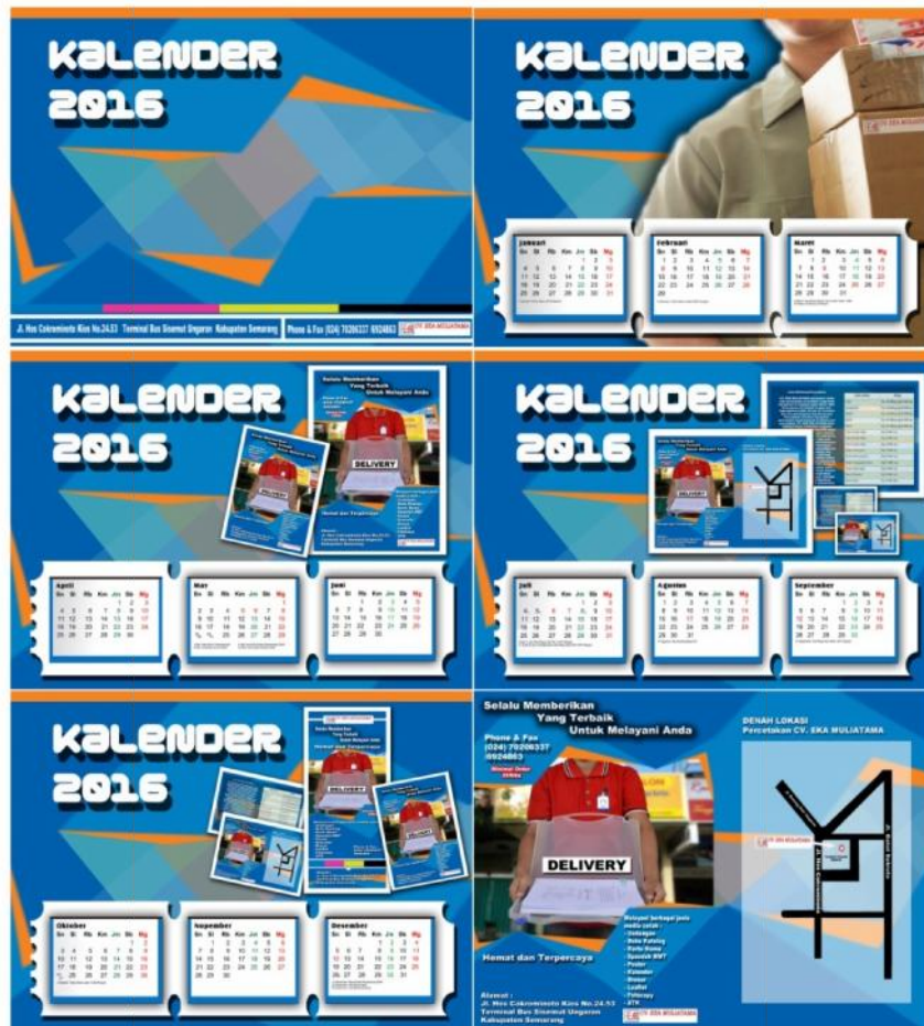
Gambar 5. Kalender