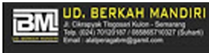
Gambar 2.10 : Logo Ud berkah mandiri