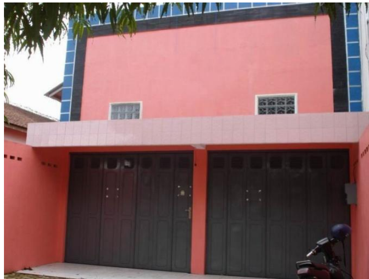
Gambar 2.11 : Kantor Ud. Berkah Mandiri