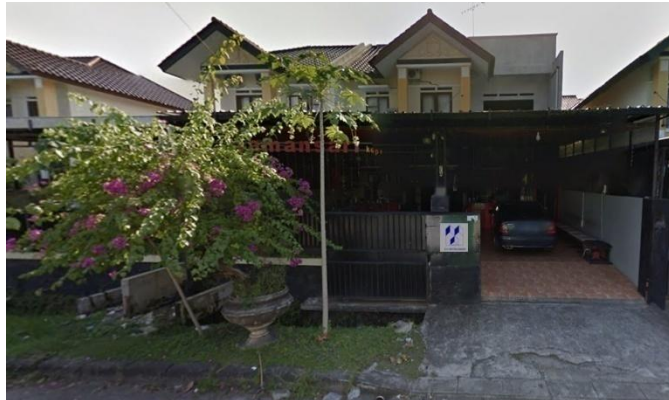
Gambar 2.4 : Kantor CV. MITRA ABADI