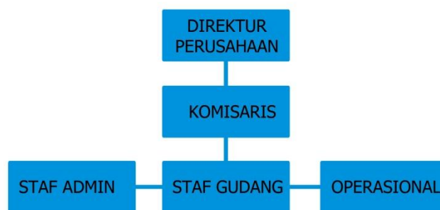
Gambar 2.2 :Struktur Bagan Perusahaan CV. MITRA ABADI

CV. memiliki karyawan dengan pelayanan yang memiliki bagian-bagian yang saling bekerja sama, berkomunikasi dan bertanggung jawab untuk mendapatkan hasil yang berkualitas agar mampu memikat klien dengan bagan struktur dibawah ini :