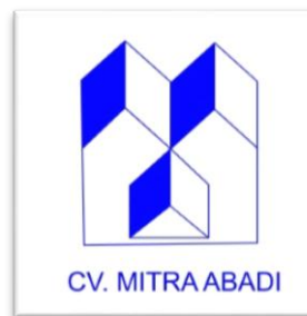
Gambar 2.1. Logo Perusahaan CV. MITRA ABADI