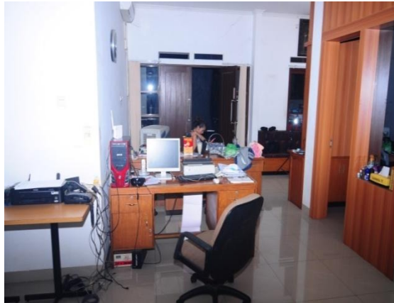
Gambar 2.7 :Ruang tungguCV. MITRA ABADI