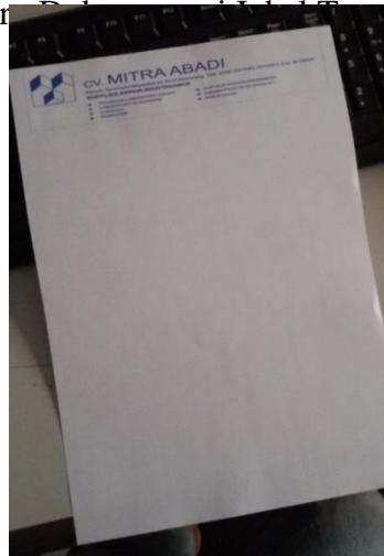
Gambar 2.8 : Kop Surat PerusahaanCV. MITRA ABADI