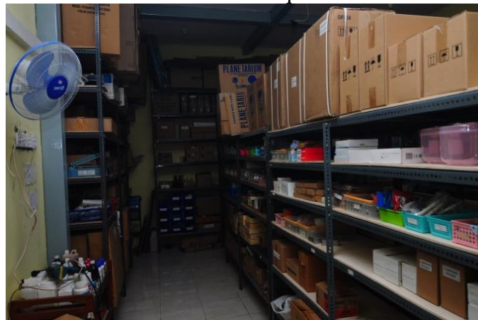
Gambar 2.5 : Ruang gudang CV. MITRA ABADI