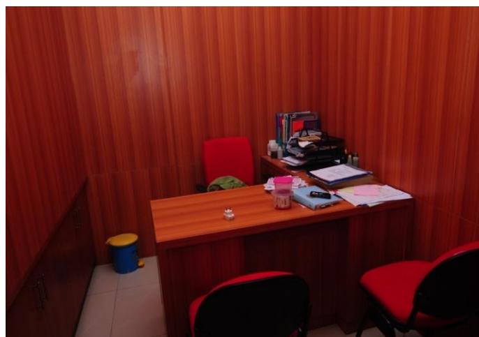
Gambar 2.6 : Ruang Komisaris CV. MITRA ABADI