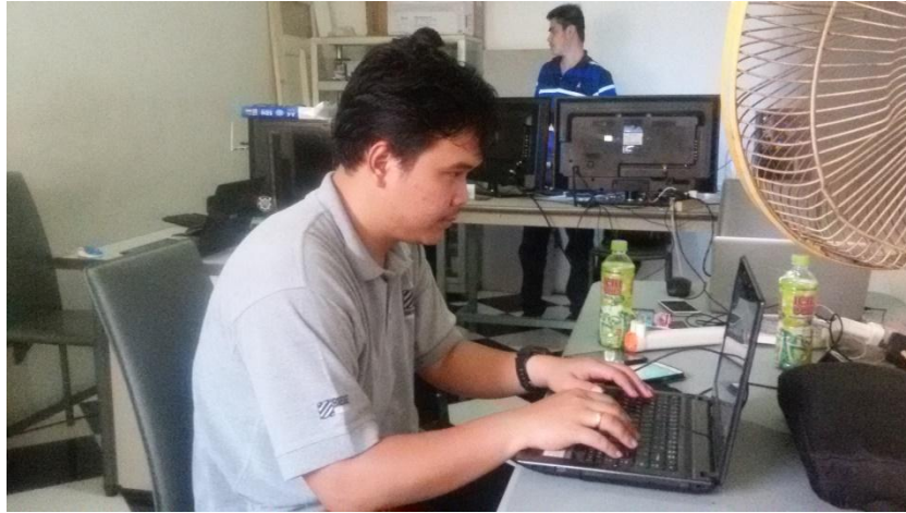
Gambar 2.13 : Pegawai Ud. Berkah Mandiri