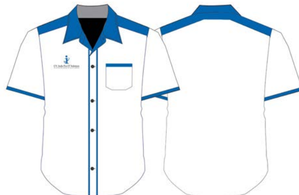
Gambar 3. Aplikasi Logo Seragam