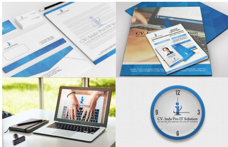
Gambar 2. Aplikasi Logo Pada Stasioneri Set