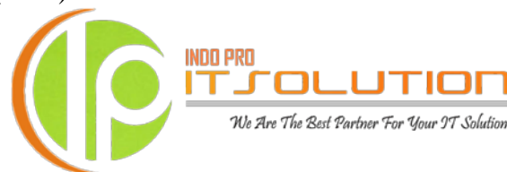
Gambar 1. Logo Lama CV. Indo Pro IT Solution

Masalah pada logo lama CV. Indo Pro IT Solution ditinjau dari visualisasi logo yang baik menurut Carter (1985).