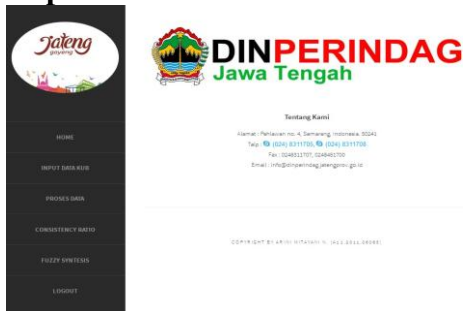
Gambar 2 Tampilan Program

Gambar 2 menjelaskan tentang halaman awal yang menampilkan menu utama seperti: Input Data KUB, Proses Data, Consistency Ratio, Fuzzy Syntesis, dan Logout.