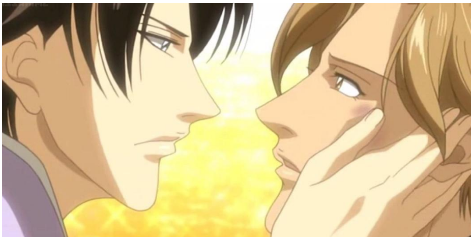
Gambar 4.13 episode 2 menit ke 08:04

Menanggapi permintaan Kusaka, Akizuki memberikan respon yang sama. Hal tersebut dapat dilihat pada episode 2 menit ke 07:58-08:05 sebagai berikut: