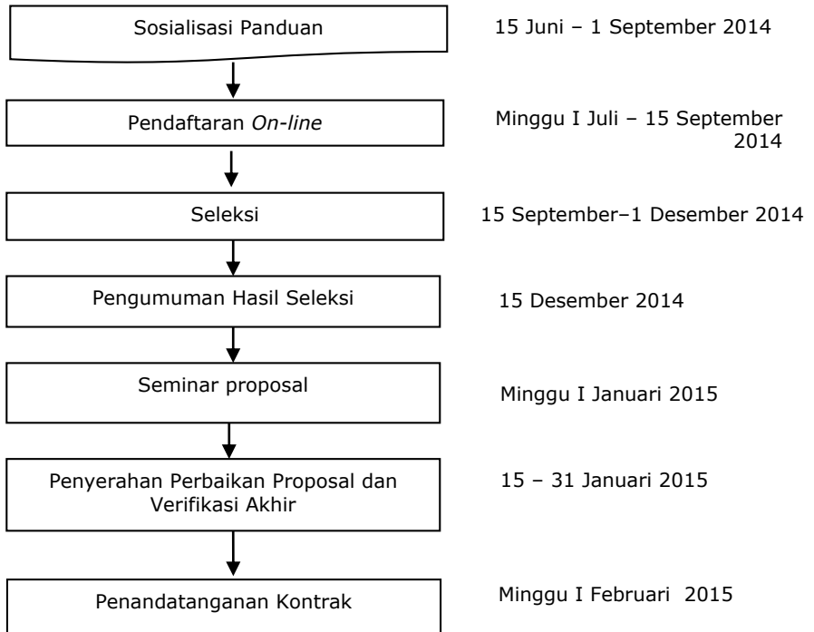
Gambar 1. Alur Seleksi Proposal KKP3N 2015

Proses seleksi KKP3N untuk proposal baru dilaksanakan dengan tahapan sebagai berikut: